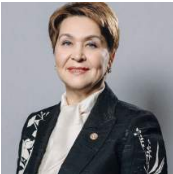
Сария Харисовна САБУРСКАЯ, Уполномоченный по правам человека в Республике Татарстан

Саратовская область и Республика Татарстан – два субъекта РФ, входящих в состав Приволжского федерального округа. За время работы Уполномоченным по правам человека в Республике Татарстан сложилась практика тесного взаимодействия и плодотворного сотрудничества между институтами омбудсменов Саратовской области и Республики Татарстан.