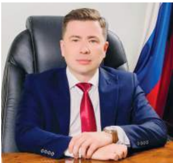
Денис Олегович ДАВЫДОВ, министр труда и социальной защиты Саратовской области

ционарном и амбулаторном лечении, а также создание достойных условий труда для медицинского персонала, что немаловажно для закрепления кадров в государственных медицинских организациях.